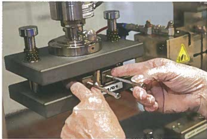
Mitarbeiterin bei der Erfassung von Messwerten