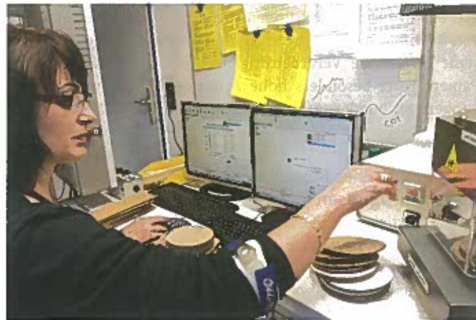
Bei der Datenerfassung am Messplatz vor Ort wird der zuständige Mitarbeiter Schritt für Schritt und leicht nachvollziehbar über eine grafische Benutzeroberfläche geführt.